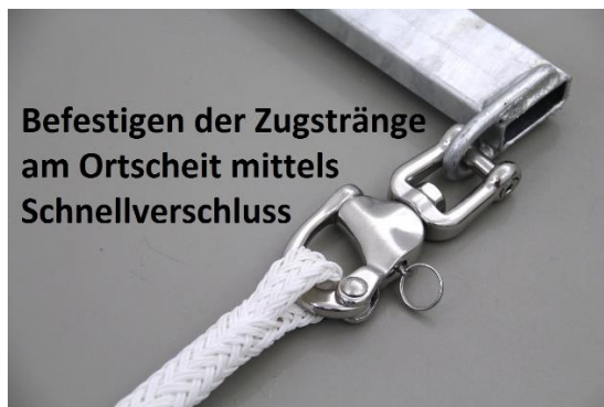
Schnellverschlüsse an den Zugsträngen

Altbekannt inzwischen schon, aber deshalb nicht minder wichtig, sind die Schnellverschlüsse an den Zugsträngen, um auch an dieser Stelle Kutsche und Pferd schnell voneinander trennen zu können. Schnellverschlüsse mit beweglichem Schäkel. Hier empfehlen wir ab Kleinpferd aufwärts die große Variante: 128 mm, Edelstahl. Für Shetlandponys reichen auch die etwas leichteren Exemplare: 90 mm, Edelstahl.