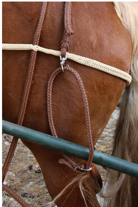
Schnellverschlüsse an den Schlagriemenschlaufen

Die Schlagriemenschlaufen verbleiben in diesem Fall an der Schere, das Pferd wird frei. Beispielhaft kannst du das auf folgendem Foto sehen: