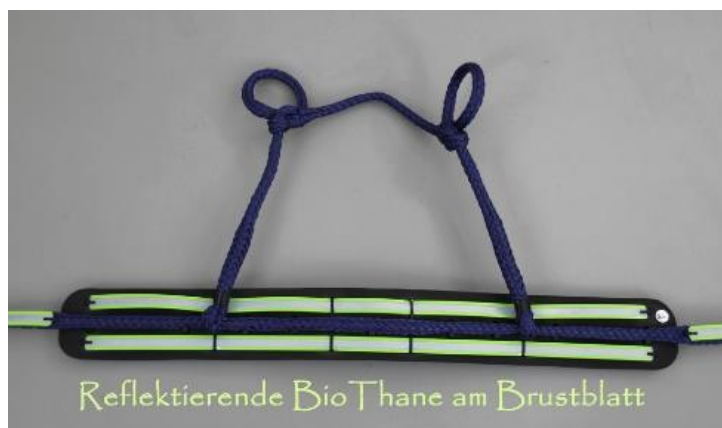
Refektive BioThane am Brustblatt